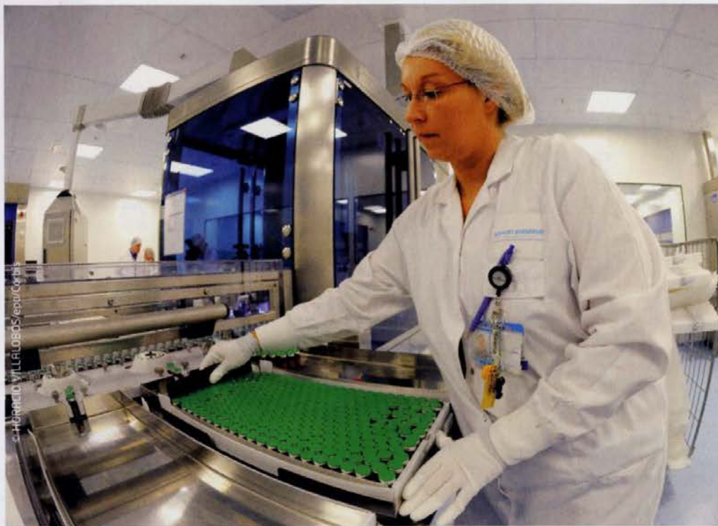
Fabrication de vaccin H1N1 dans les laboratoires Sanofi-Pasteur de Val-de-Reuil (France), en octobre 2009.